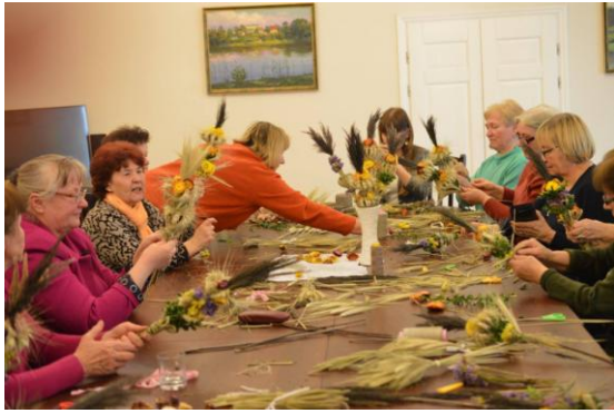
9 pav. Verbų rišimo edukacija

2017 m. buvo vedamos 44 ekskursijos, kuriose dalyvavo 798 turistai - iš Lietuvos: Vilniaus, Kauno, Plungės, Alytaus, Vilkautinio, Vilkaviškio, Druskininkų, Tytuvėnų, ir kt. vietovių; bei turistams iš Lenkijos. Taip pat aktyviai ekskursijose dalyvavo Lazdijų rajono mokyklų mokiniai iš Kučiūnų, Šventežerio, Lazdijų, Seirijų, Kapčiamiesčio, Aštrosios Kirsnos, Šeštokų. Direkcijos specialistai pravedė 36 edukacinius užsiėmimus 703 mokiniams. Galima pasidžiaugti, kad edukacinėmis programomis