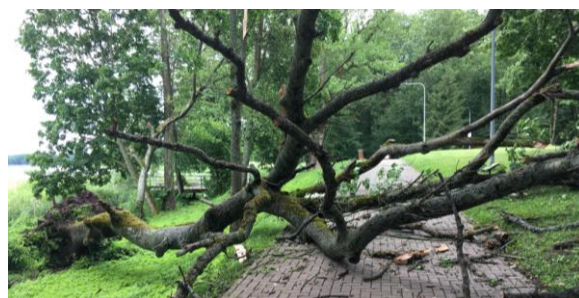
3 pav. Išvirtęs paprastasis uosis Veisiejų dvaro parke