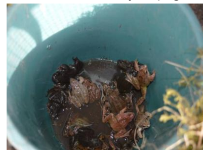
1 pav. Apskaita prie varliagyvių pralaidos

2017 m. buvo tęsiama Veisiejų miesto istorinės dalies sodybų inventorizaciją Vytauto, Kreivojoje, Montvilos ir Leipalingio gatvėse. Inventorizuota 44 Veisiejų miesto istorinės dalies etnografiniu požiūriu