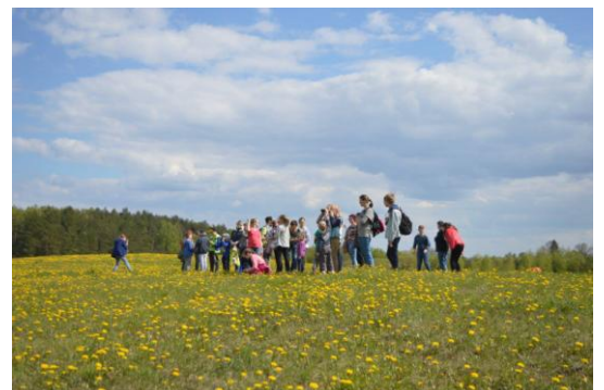
8 pav. Edukacinis užsiėmimas gamtoje

Per pastaruosius metus skaitytos 9 paskaitos visuomenei,