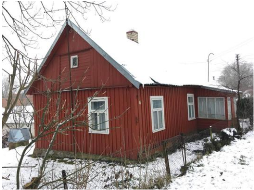
5 pav. Nuotrauka iš vykdomos sodybų inventORIZACIJOS Kreivojoje g.

ankstesniais laikotarpiais buvo stipri pagalba prižiūrint ir tvarkant teritorijas. Tačiau buvo organizuotos net 4 talkos, kurių metu take per Petroškų mišką prakirstos atžalos, sutvarkytas Šlavantų piliakalnis bei sutvarkyta dalis Šiaurinės Ančios ežero apyežerės. Per 2017 metus iš ežerų pakrančių, pamiškių, rekreacinių ir kitų teritorijų surinkta ~650 kg šiukšlių.