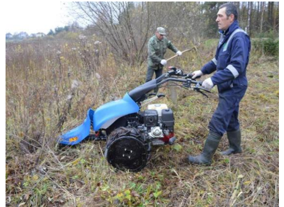
6 pav. Teritorijų priežiūra su kolegų turime technika

darbininkai iš Lietuvos darbo biržos, kurie