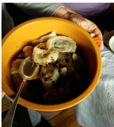
4 pav. Nuotrauka iš vykdomo tyrimo „Dzūkų tradicijos. Kūčios“

Vykdytas kraštovaizdžio monitoringas rodo, kad 2017 m. vykdyta ūkinė veikla didesnės neigiamos įtakos parko kraštovaizdžiui, biologinei įvairovei ir saugomoms parko kultūros bei gamtos paveldo vertybėms nepadarė. Lyginant žemėnaudos struktūrų pokyčius su 2005 m. įvertinta, kad didėja pievų užžėlimas mišku, buvusiose kirtavietėse atsikuria miškas. Veisiejų ir Vainežerio dvarų parkuose po šių metų birželio 30 dieną siautusio gūsingo vėjo išvirto keletas šimtamečių medžių: