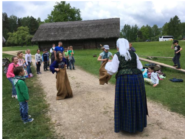
10 pav. Regioninių parkų 25-mečio šventė Rumšiškėse

2017 metais Veisiejų regioninio parko direkcija šventė 25 - metį. Gegužės mėn. 25 d. dalyvavo visų regioninių parkų 25-mečio šventėje Rumšiškėse, skleidžiant Veisiejų regioninio parko išskirtinę vertę bei prisimenant nuveiktus prasmingus darbus. Taip pat ši graži sukaktis paminėta organizuojant talką orchidėjų buveinės išsaugojimui Šiaurinėje Ančios ežero apyžerėje.