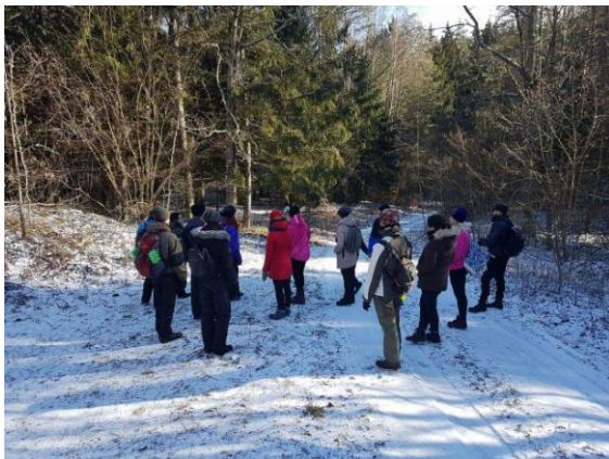
7 pav. Pėsčiųjų žygis per Petroškų mišką

Per 2017 metus direkcijos pareigūnai atliko 161 planinį ir neplaninį patikrinimą. 121 planiniai patikrinimai, 11 iš jų atlikti vertinant draustinių būklę ir 45 patikrinimai neplaniniai. Vyr. specialistas, vykdamas reindžerio - rekreacininko funkcijas, vykdė