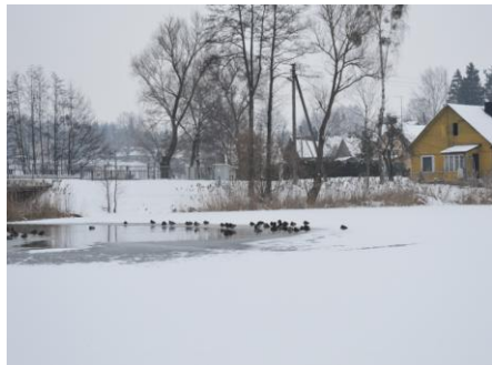
2 pav. Žiemojančių vandens paukščių apskaita Ančios ežere

2017 m. Veisiejų regioninio parko direkcija vykdė gamtinius tyrimus: balinio vėžlio ir valstybinį upinės žuvėdros monitoringus, žiemojančių vandens paukščių, taurinės pudmės ir varliagyvių prie pralaidos apskaitas. Vykdyta balinio vėžlio dėtaviečių apskaita parodė, kad kasmet dėčių skaičius didėja - šiais metais užfiksuotos 25 dėtys, lyginant su 2016 m. 6 - iomis dėtimis daugiau. Taip pat didėja ne vien dėčių skaičius, bet ir aptinkamos naujos teritorijos su dėtavietėmis.